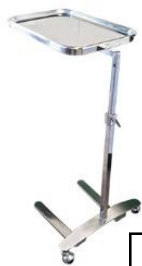
โต๊ะเมโย