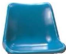
รูปที่ 2 ตัวเก้าอี้ที่นั่ง